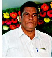
పట్నాల సాయికుమార్ జిల్లా అక్రిడిటేషన్ కమిటీ సభ్యులు గుంటూరు జిల్లా