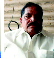
గుండ రామకృష్ణ జిల్లా అక్రిడిటేషన్ కమిటీ సభ్యులు పశ్చిమ గోదావరి జిల్లా