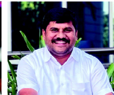
గొట్టిపాటి నాగేశ్వరరావు జిల్లా అక్రిడిటేషన్ కమిటీ సభ్యులు ప్రకాశం జిల్లా