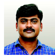
ఎం. ఎన్. లక్ష్మి జిల్లా అక్రిడిటేషన్ కమిటీ సభ్యులు కాకినాడ జిల్లా