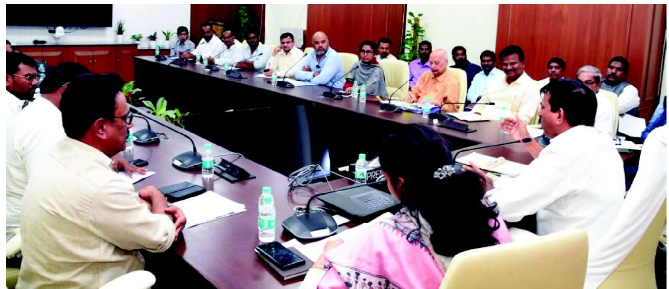
మంత్రి పొంగులేటి శ్రీనివాసరెడ్డి నేతృత్వంలో సమావేశం నిర్వహించినప్పటి దృశ్యం