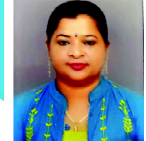
టి. వాసి జిల్లా అక్రిడిటేషన్ కమిటీ సభ్యులు తిరుపతి జిల్లా