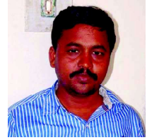
షణ్ణిపుల్లా జిల్లా అక్రిడిటేషన్ కమిటీ సభ్యులు అనంతపురం జిల్లా