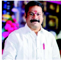
గంట్ల శ్రీనుబాబు జిల్లా అక్రిడిటేషన్ కమిటీ సభ్యులు విశాఖపట్నం జిల్లా