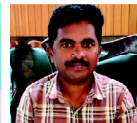
బెజ్జంకి శ్రీనివాస్ జిల్లా అక్రిడిటేషన్ కమిటీ సభ్యులు తూర్పు గోదావరి జిల్లా