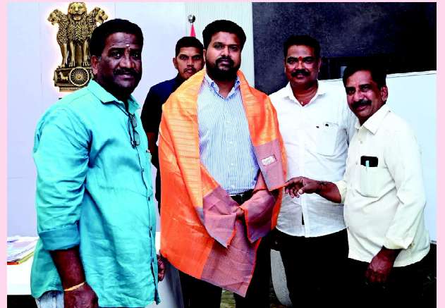
డా. అంబేద్కర్ కోనసీమ

జర్నలిస్టుల అక్రిడిటేషన్ కమిటీల ఏర్పాటు అనంతరం వివిధ జిల్లాలో కలెక్టర్లను కలిసి కృతజ్ఞతలు తెలియజేసిన ఫెడరేషన్ ప్రతినిధులు