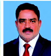
పి. జాకీర్ హుస్సేన్ జిల్లా అక్రిడిటేషన్ కమిటీ సభ్యులు అన్నమయ్య జిల్లా